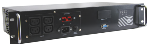
Intelligent II 600RMLT SE