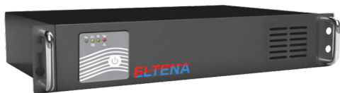
Intelligent II 600, 1000RM/RMLT