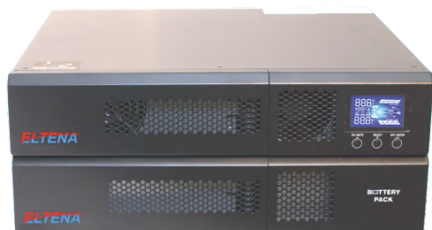
Monolith E 3000RTL с батарейным блоком BFR96-9E (приобретается отдельно)